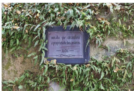
Placa afixada no troço da muralha de chunambo, dentro do Colégio Mateus Ricci, na Travessa de S. Paulo, nº 1-A, com a seguinte descrição: muralha que cercava a propriedade dos jesuítas - 1606 – Foto MV Basílio, em 2021

Por conseguinte, as primeiras ameaças dos holandeses para tomar a Cidade de Macau foram sobretudo em 1603 e 1604. Foi então que os jesuítas sentiram a necessidade de proteger as suas propriedades à volta do Colégio, bem como a nova igreja de S. Paulo, que tinha sido inaugurada na noite de 24 de Dezembro de 1603.