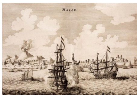
Gravura de Joan Nieuhof , de 1665, reproduzindo, de forma fantasiada, o ataque dos holandeses à Cidade de Macau.