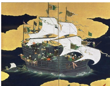
Biombo representando a nau do trato (ou nau preta) dos namban jin (os bárbaros do sul, como eram designados os portugueses) na viagem ao porto de Nagasáqui, Japão.

Para poderem comercializar com os japoneses, os holandeses conseguiram criar, em 1609, um posto comercial em Hirado como base de operações da Companhia Holandesa das Índias Orientais no Japão. Apesar disso, em breve verificaram que tal posto era de pouca rentabilidade, comparado com o de Nagasáqui, visto que os portugueses facilmente obtinham a seda crua e outros produtos chineses do mercado de Cantão, enquanto que os holandeses e ingleses dependiam da captura dos carregamentos a bordo de embarcações chinesas e portuguesas.