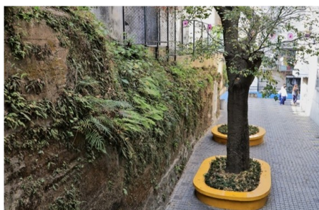
Troço da muralha que cercava a propriedade dos jesuítas, visto num outro ângulo. Foto MV Basílio, em 2021

Por conseguinte, as primeiras ameaças dos holandeses para tomar a Cidade de Macau foram sobretudo em 1603 e 1604. Foi então que os jesuítas sentiram a necessidade de proteger as suas propriedades à volta do Colégio, bem como a nova igreja de S. Paulo, que tinha sido inaugurada na noite de 24 de Dezembro de 1603.